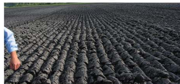
Goede dekking groen en stoppel