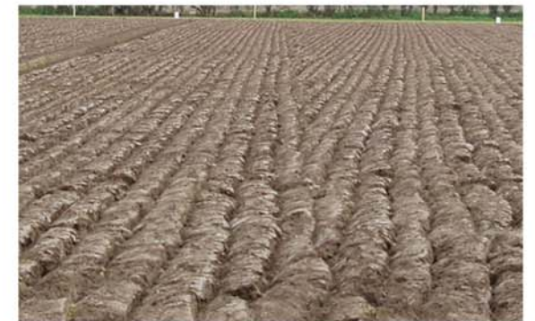
Aanstorting van de geer Wentel